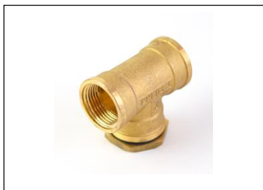
RACCORDO PORTASONDA 1/2" - 3/4" - 1" (Ø5 mm)