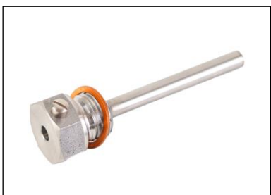
MONTAGGIO SONDA ASCIUTTO DN 50-65-80-100-125 (Ø6 mm)