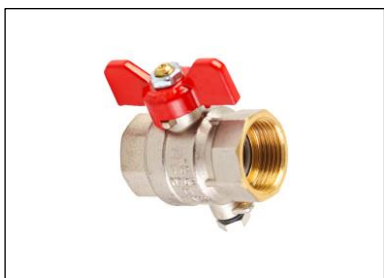
VALVOLA A SFERA PORTASONDA 1/2" - 3/4" - 1" (Ø5 mm)