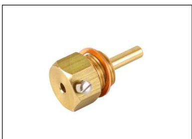
MONTAGGIO SONDA ASCIUTTO DN 15-20-25-32 (Ø5 mm)